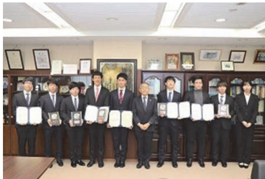
学長を囲んで記念撮影

授与式後は、受賞者から学長にこれまでの取組や今後の意気込み等が語られ、和やかに懇談が行われました。最後に学長から、「今回の受賞は他の学生の目標や励みとなるので、自信をもって今後も皆様がさらなる活躍をされることを期待しています」とエールが送られました。